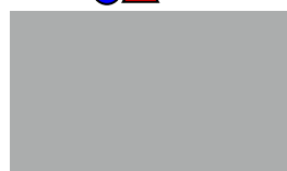
16- Gris Xeviot