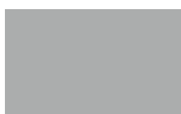
16- Gris Xeviot