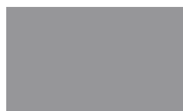
17-Gris Medio (No Orgánico)